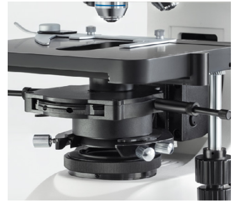
OBN-15: Condensador montado de contraste de fases