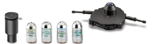
Condensador universal PH quintuple con 10×/20×/40×/100× Objetivos Plan-PH Infinito (set completo, Incluido en OBN-15)